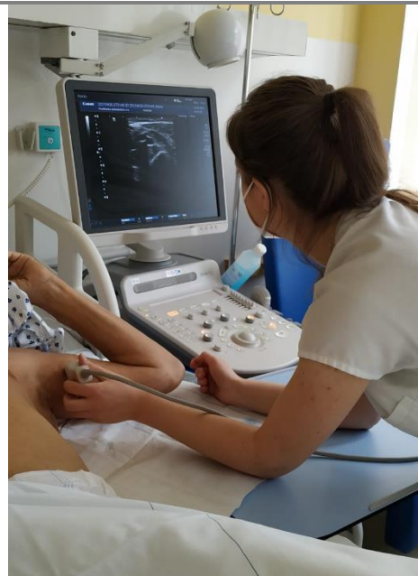
Příprava N/K k výkonu

Velkou výhodou, kromě délky používání, je možnost odběrů krve.