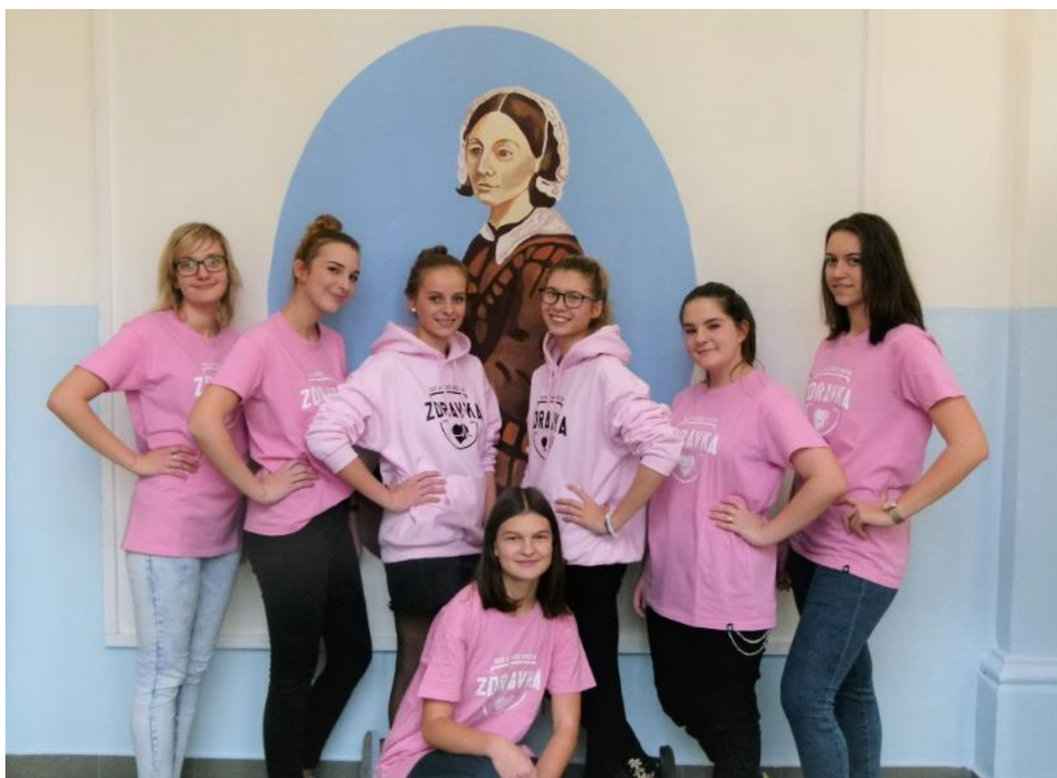
Kampaň „Budu sestra“ od studentek MG, SZŠ a VOŠZ Vsetín

https://www.mzcr.cz/ctvrta-zprava-o-aktivitach-nursing-now-v-cr/