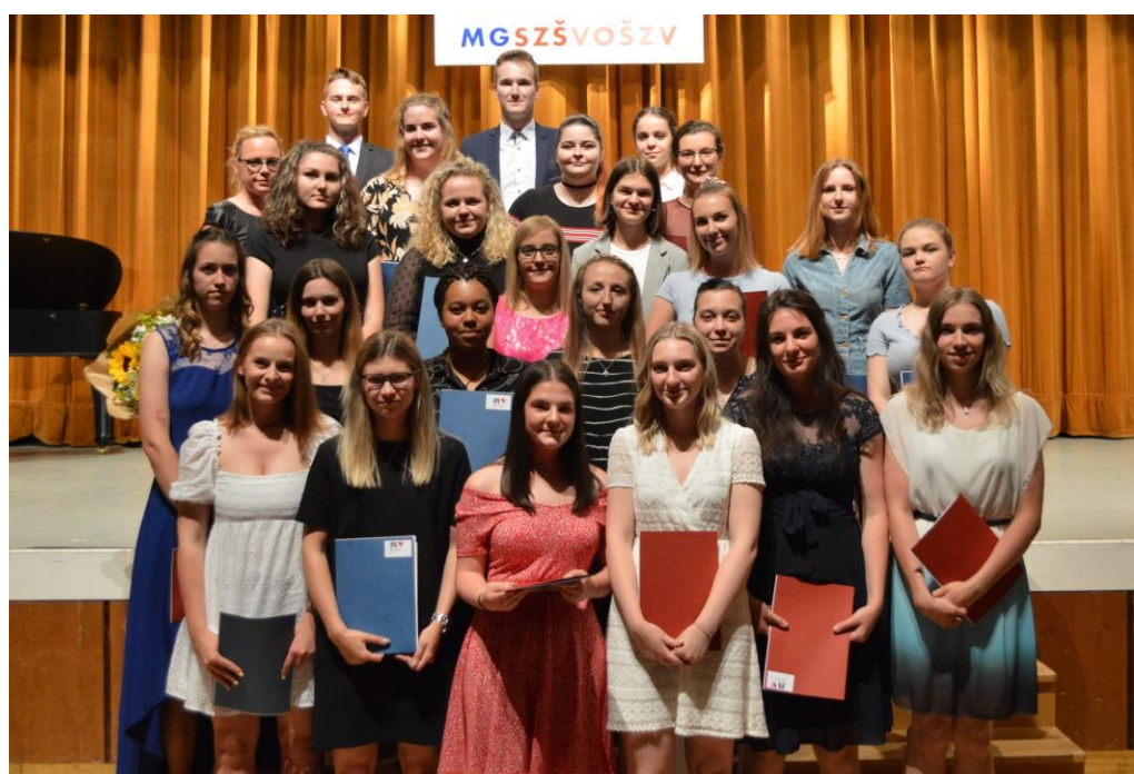
Čerství absolventi SZŠ Vsetín, obor Zdravotnický asistent, 2021