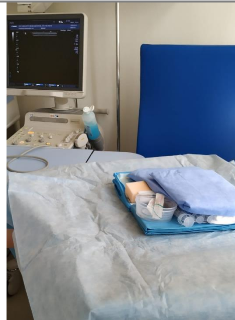
Pomůcky na sterilním stolku

Pokud do zavedeného midline katetru nepodáváme žádné léky, je nutné při hospitalizaci minimálně jednou za směnu zkontrolovat návrat a katetr propláchnout a okolí vpichu převázat, při použití