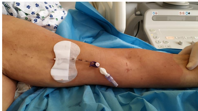
Zavedený midline katetr

V naší republice si v různých nemocničních zařízeních na různých pracovištích nachází své místo, ale ještě zdaleka není uplatňován celoplošně na denní bázi, jako je tomu u periferních kanyl. Ve Vsetínské nemocnici je zatím zaváděn a využíván zřídka, ovšem snahou a cílem je midline katetr v praxi uplatňovat více a častěji a naučit se využívat jeho výhod, které přináší jak pro pacienta, tak pro personál.