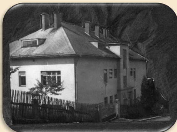
Budova SZŠ v ulici Jabloňová

Na zelené stráni stojí škola bílá, řadami svých oken do města se dívá. Proč je nám tak vzácná? Proč je nám tak milá? Učí chránit život, když se připozdívá.