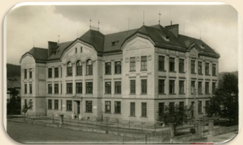
Budova SZŠ na Náměstí Osvobození