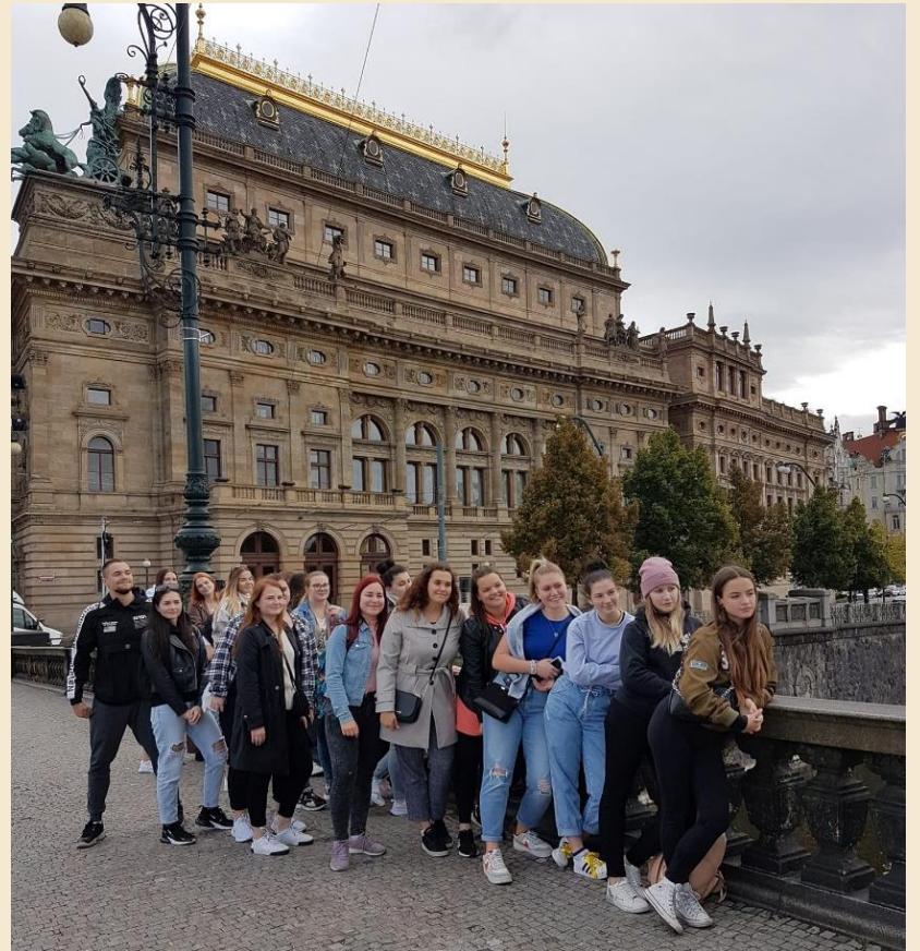
Exkurze 4. ZA v Praze