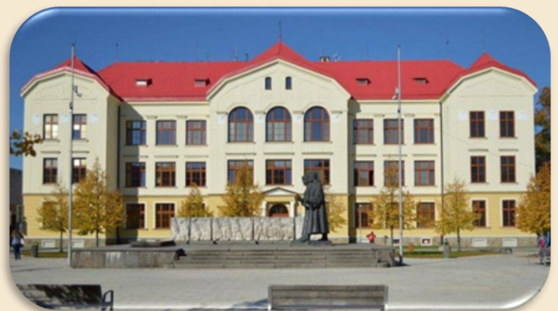
Střední zdravotnická škola a Vyšší odborná škola zdravotnická Vsetín v roce 2020