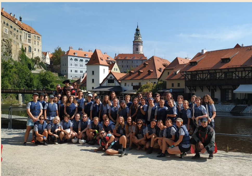
Kurzy vodní turistiky 3. ročníků na Vltavě