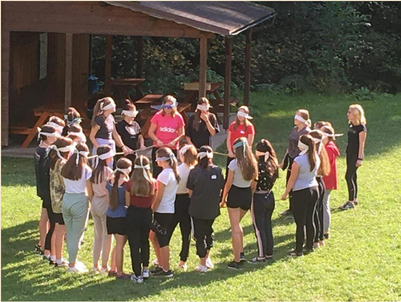
Adaptační pobyt 1. ZB