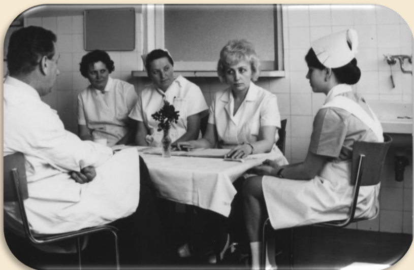
Praktická maturitní zkouška