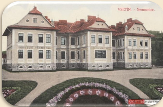
Vsetínská nemocnice