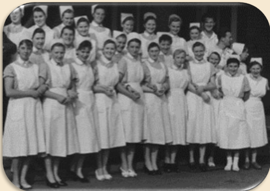
Absolventky SZŠ Vsetín

Pamatuju si, jak jsme chodily s paní učitelkou odebírat krev. To šel konvoj a vše toho konvoje šla taková ta šťastná, která momentálně odebírala. To vy si nemůžete pamatovat, tehdy byly ještě jehly v Petryho misce vyskládány do vějíře a v podstatě jsme si ty injekce sestavily. Vzaly jsme si tělo stříkačky, zasunuly jsme si píst, pomocí peánu jsme nasadily jehlu. Když byla potom akce skončena, tak jsme ty jehly prošťuchovaly mandrénem a čistily kartáčkem a znovu sterilizovaly, takže to byla opravdu taková doba dřevní.