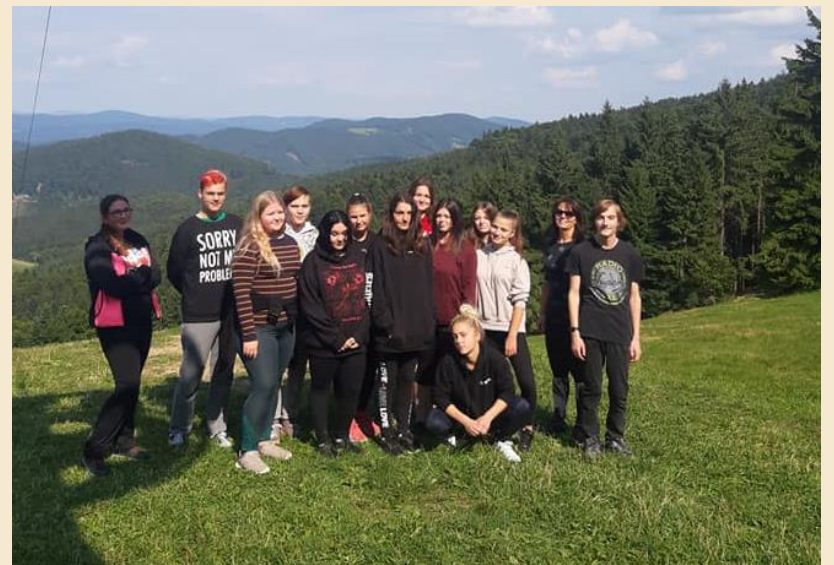
Adaptační pobyt 1. ZO