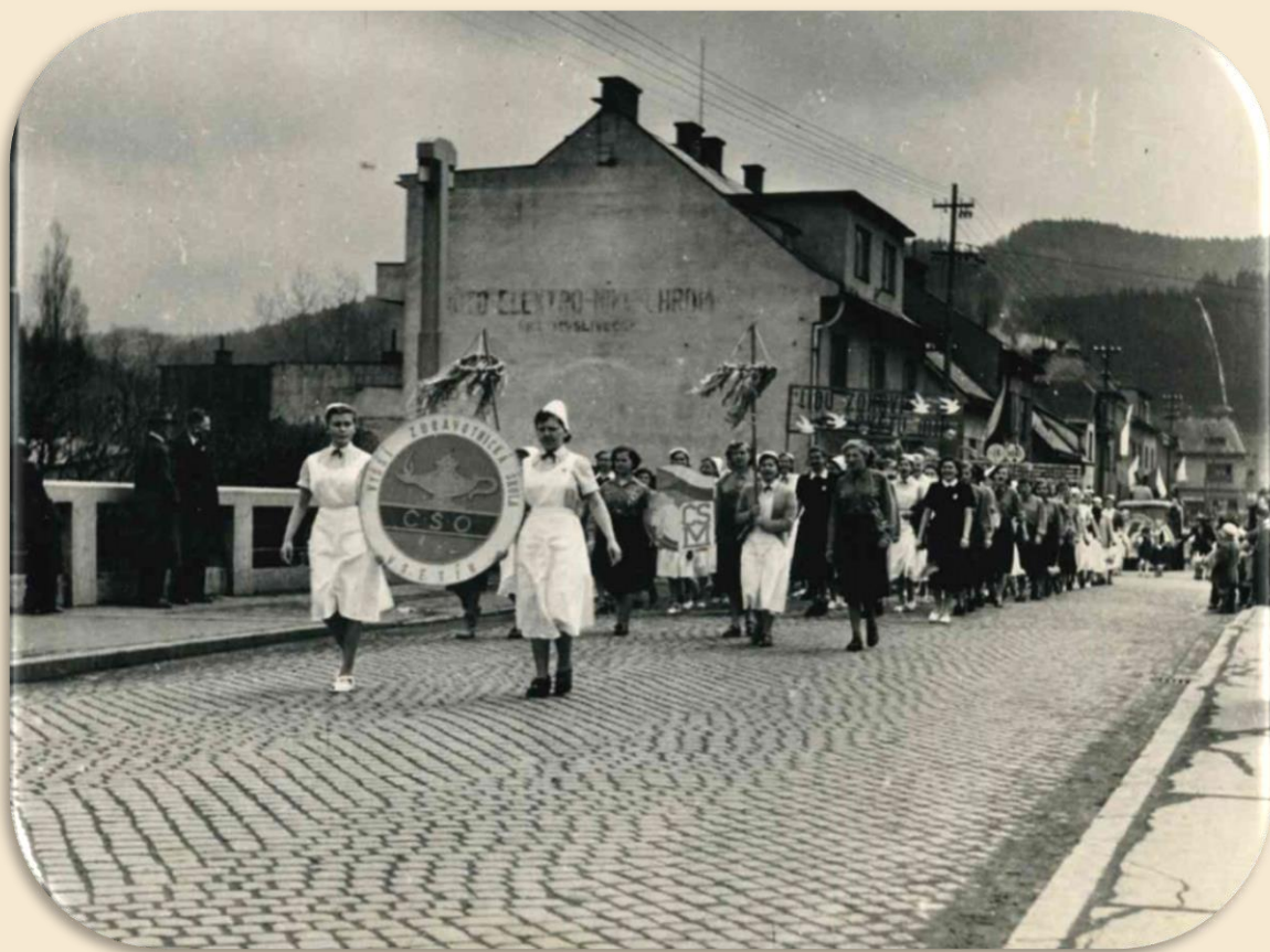
Účast VZŠ Vsetín na 1. máje ve školním roce 1953-54