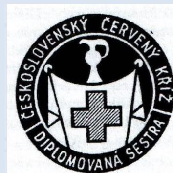
Odznak prvních diplomovaných sester

Odznak zdravotní sestry patří mezi nejvýznamnější symboly sesterské profese. Vzhled odznaku stejně jako oděv procházel mnohými změnami.