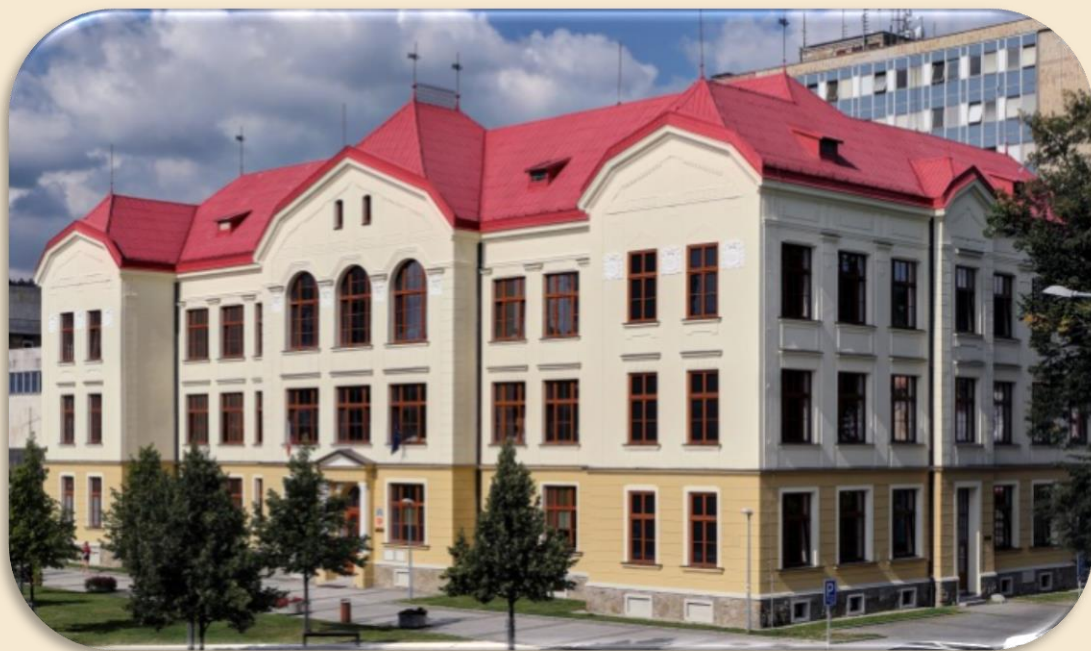
Budova Střední zdravotnické školy a Vyšší odborné školy zdravotnické Vsetín

V nynějším čísle Teploměru zavzpomínáme na počátky vzdělávání zdravotních sester ve Vsetíně a přeneseme se v čase nad vzpomínkami našich kolegyní na studijní léta a začátky jejich profesní kariéry. Dáma s lampou – tak se říkalo Florence Nightingalové podle jejího hesla, že ošetrovatelská péče trvá dnem i nocí bez přestání. Přeji Vám milí studenti, abyste svou práci dělali s láskou a nasazením dnem i nocí.