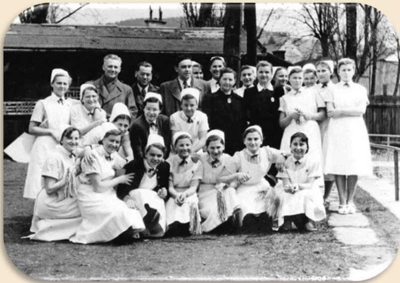
První absolventky, které studovaly v letech 1951-1954

Ve školním roce 1962/63 byl zaveden obor DĚTSKÁ SESTRA . Z důvodu nedostatku učeben byla výuka realizována taktéž na Horní škole, v sále hvězdárny, na učňovské škole a v roce 1965 započala přístavba stávající školy na Jabloňové ulici, která byla slavnostně otevřena 17. února 1967.